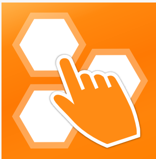
GBS Workflow Manager